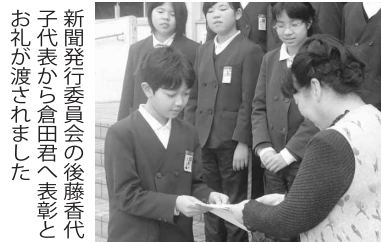
倉田君の原画と4点の佳作は16面に掲載しています。